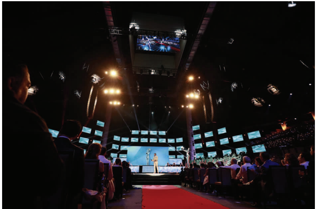
CONSEJO DE PROMOCIÓN TURÍSTICA DE QUINTANA ROO